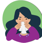
Nez qui coule