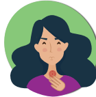
Mal de gorge