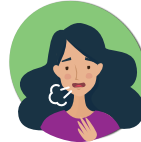
Difficulté à respirer